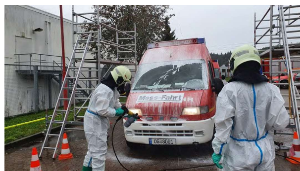
Dekontamination eines CBRN-Erkunders