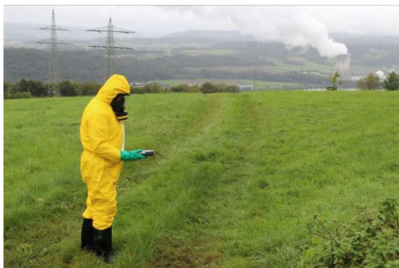
Messung vor dem KKW Leibstadt

(RPF) Die Bewältigung eines kerntechnischen Unfalls wird im Rahmen einer Gesamtnotfallübung (GNU) von schweizerischen Behörden und dem grenznahen Ausland im Rhythmus von zwei Jahren geübt. Neben Behörden aus Baden-Württemberg und Deutschland nahmen im Verlauf der zweitägigen Übung auch Strahlenspürtrupps der Feuerwehren aus dem Regierungsbezirk Freiburg daran teil.