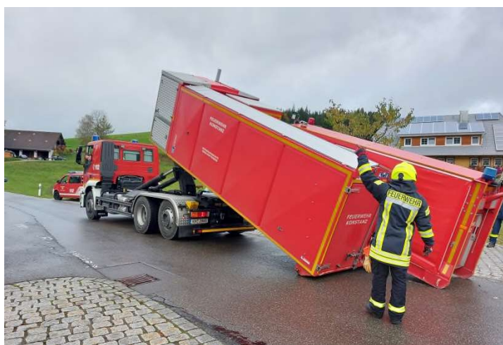
Abrollbehälter Hytrans Fire System (AB-HFS)