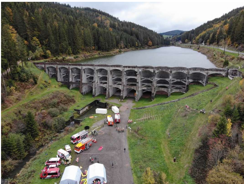
Eine Drohnenaufnahme der Übung an der Linachtalsperre.

(RPF) Ereignisse wie die Hochwasserkatastrophe im Ahrtal oder die Waldbrände in Brandenburg und Sachsen zeigten, dass für die Bewältigung solcher Schadensereignisse die Zusammenarbeit mehrerer Landkreise notwendig ist.