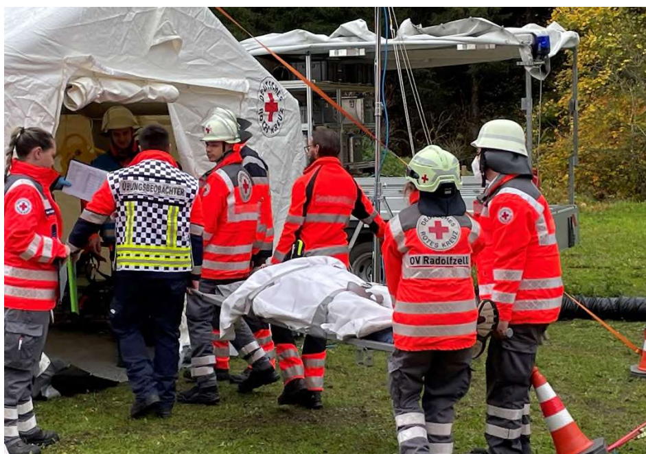
Auch ein Massenansturz von Verletzten wurde bewältigt.

Bei der Bewältigung der Schadenslage galt es, die Wasserförderung über eine lange Wegstrecke zu beüben. Die Wegstrecke um die es sich handelte, war insgesamt ca. 5 km lang, umfasste ca. 160 Höhenmeter und wurde durch drei Züge Wasserförderung hergestellt. Außerdem musste technische Hilfe geleistet werden, um sowohl die Bühne vor einem Absturz zu bewahren als