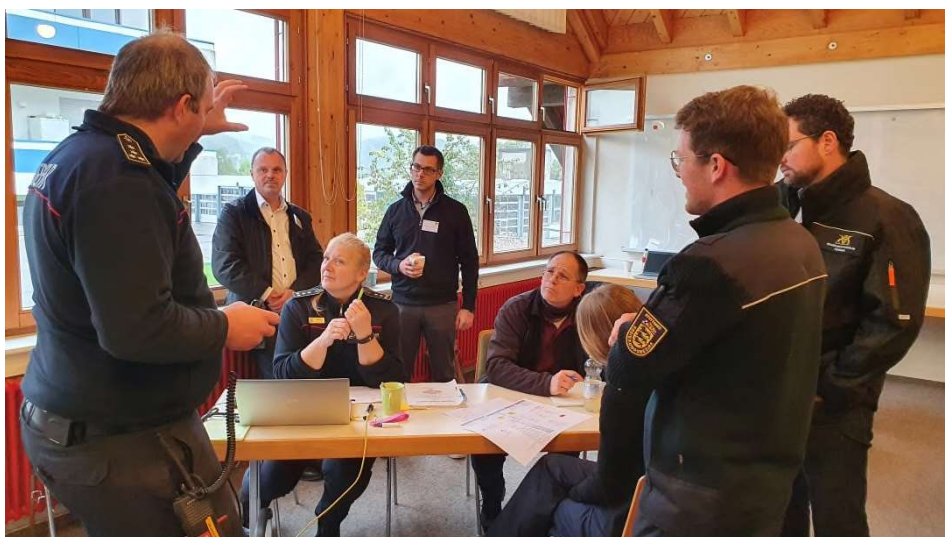
Einblicke in die Lokale Messzentrale (LMZ) unter technischer Einsatzleitung der Landesfeuerwehrschule

(TEL) der Landesfeuerwehrschule Baden-Württemberg (LFS) im Feuerwehrgerätehaus Kaitle unter großem personellen Einsatz der örtlichen Feuerwehr Waldshut-Tiengen eingerichtet.