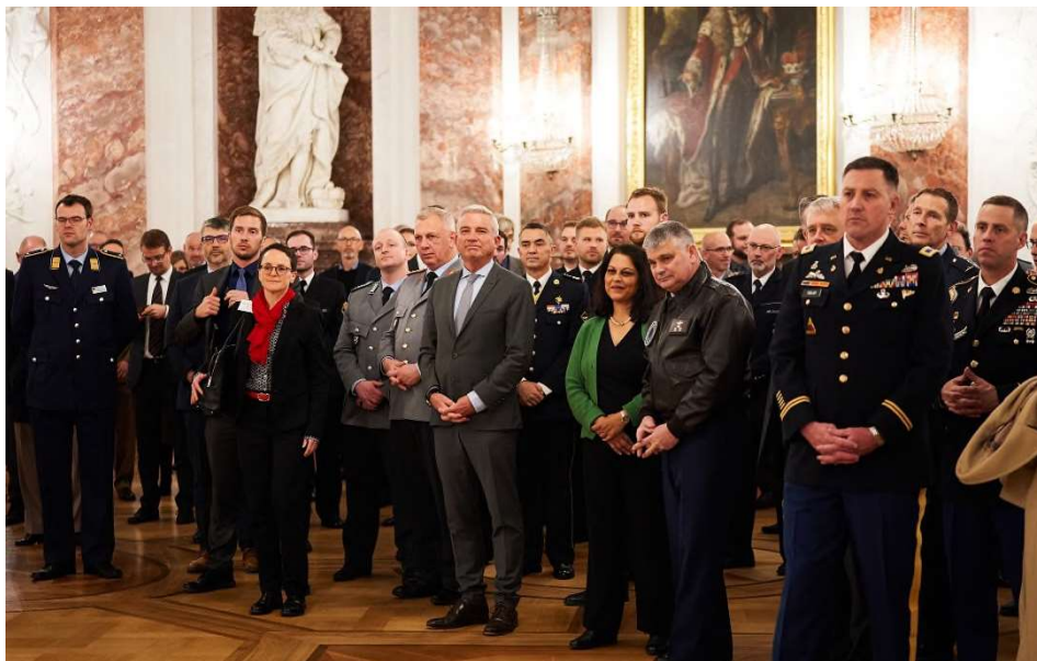
Innenminister Thomas Strobl und die Gäste des Jahresempfanges für die im Land stationierten Streitkräfte im Ritteraal des Schlosses in Mannheim. Alle Bilder dieses Artikels: Steffen Schmid

(ID) Die Landesregierung hat am 10. November 2022 Vertreter der Bundeswehr und der befreundeten Streitkräfte aus Europa und den USA sowie Vertreter aus Polizei, Politik und Verwaltung im Mannheimer Schloss empfangen.