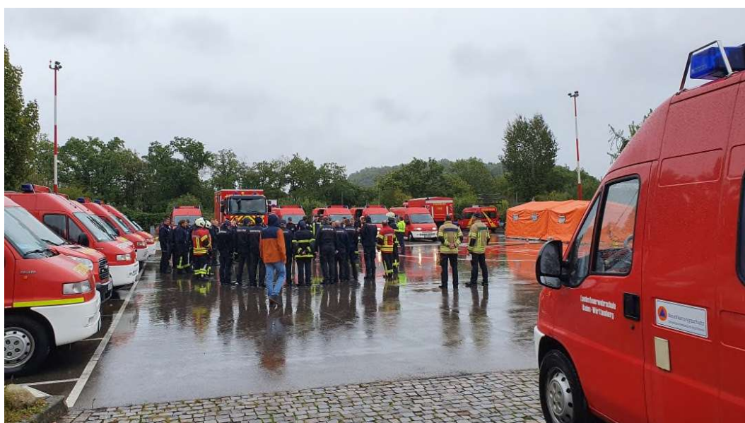
Letzte Erklärungen zum Einbau der Erkunder-Simulation in die CBRN-Erkunder