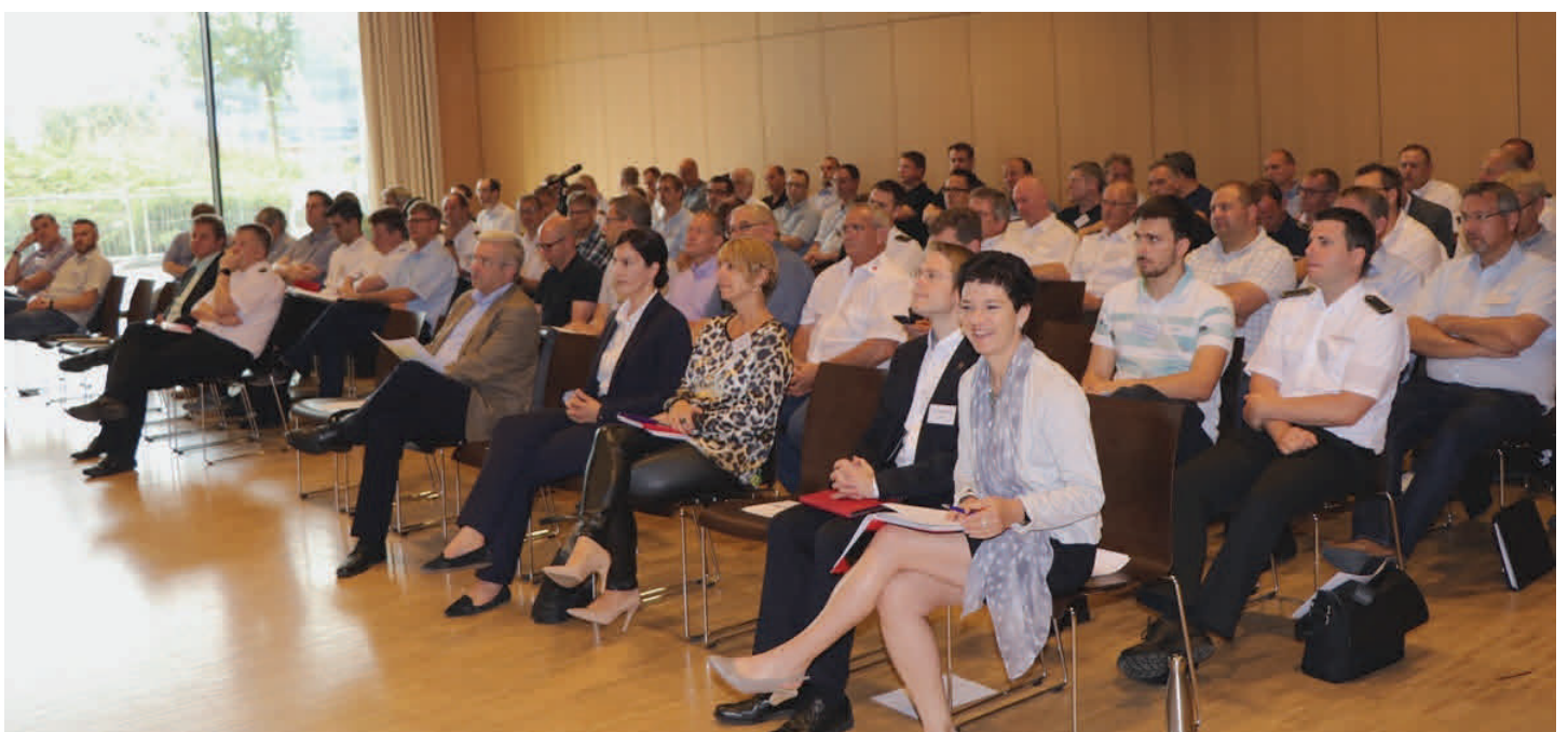
Großes Interesse an der dritten Leitstellentagung im Innenministerium

Derzeit werde auf Bundesebene abgestimmt, ob und wie die Notruf-App eingeführt werden kann.