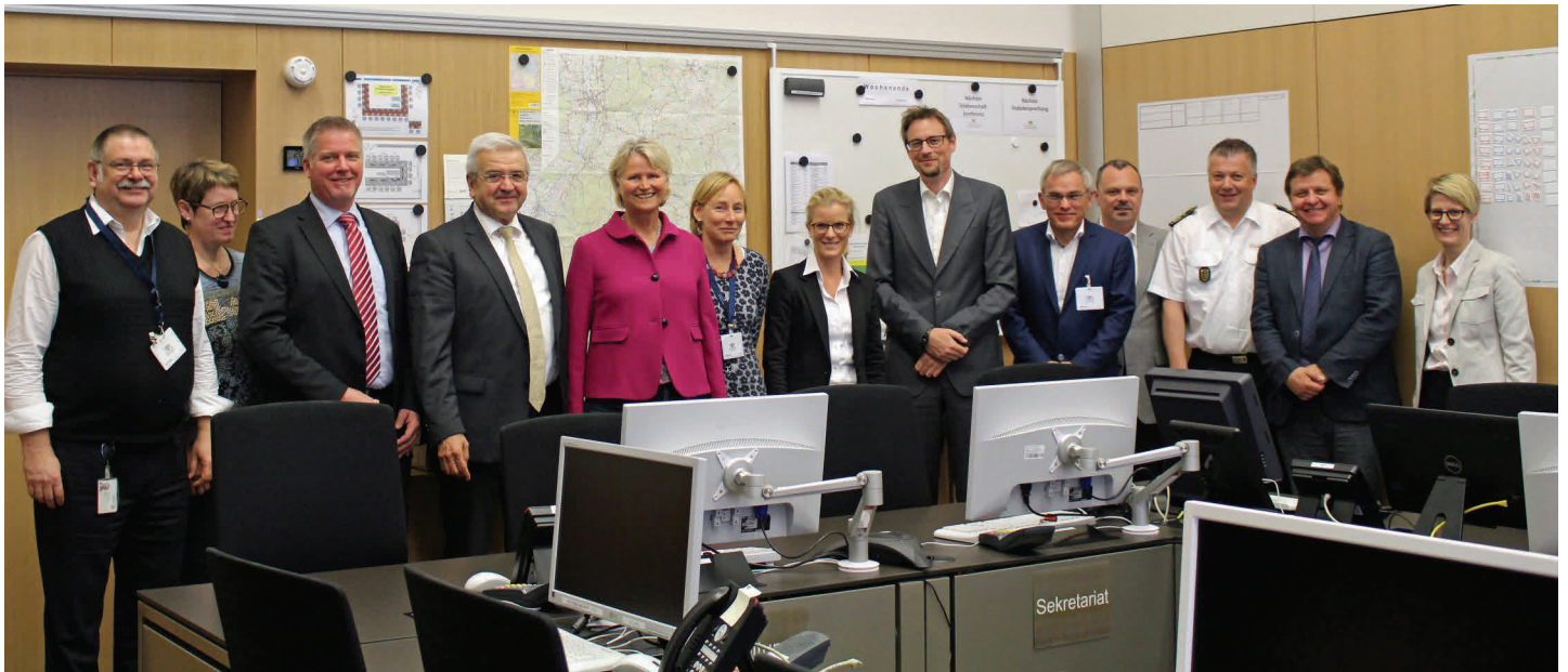
Kolleginnen und Kollegen aus Nordrhein-Westfalen und Baden-Württemberg bei der gemeinsamen Besichtigung der Lageräume im Landeslagezentrum.

Welche rechtlichen Wirkungen haben Entscheidungen des interministeriellen Verwaltungsstabes unter dem Blickwinkel der Ressortzuständigkeit?