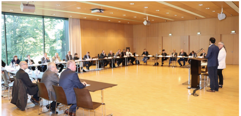
Ein Blick in die Tagungsrunde.