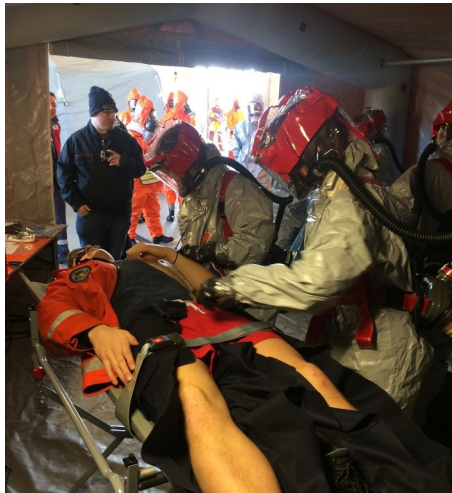
Dekontaminationsübung der Feuerwehren Heidelberg, Ladenburg, Hemsbach und Neckarbischofsheim gemeinsam mit der DRK-Einsatzinheit aus Heidelberg im Januar 2017

Nach dem Konzept werden die kontaminierten, verletzten Personen aus dem Gefahrenbereich kommend über einen Verletztendekontaminationsplatz unter Berücksichtigung lebenserhaltender Basismaßnahmen einem