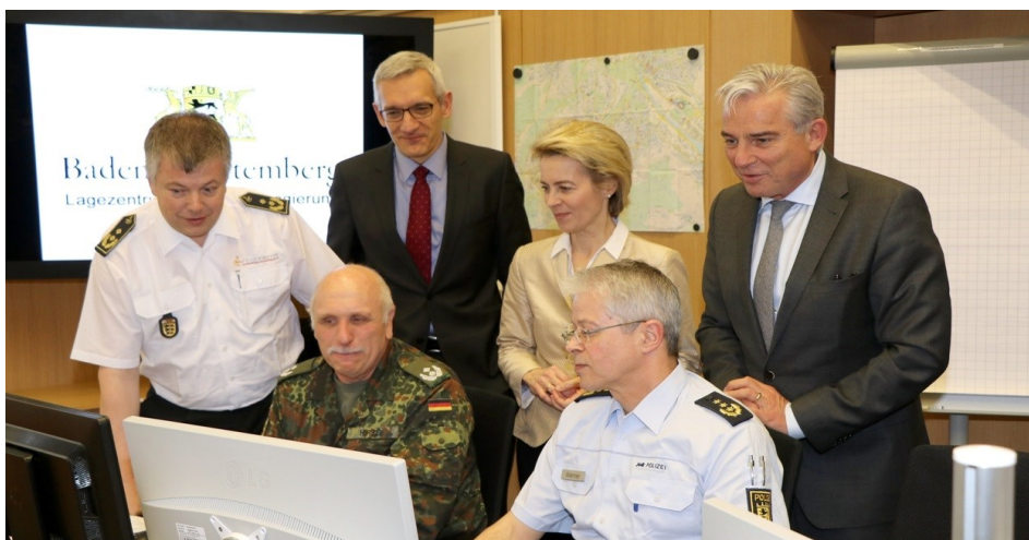
Verteidigungsministerin Ursula von der Leyen und Innenminister Thomas Strobl informieren sich über den aktuellen Stand der Lage.

Quellen: Bei Bildern ohne Quellenangabe liegt das Copyright beim Ministerium für Inneres, Digitalisierung und Migration. Für externe Quellenangaben kann keine Verantwortung und Haftung übernommen werden.