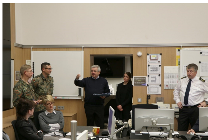
Lagebesprechung im Lagerraum

Bundeswehr zur Unterstützung beim Objektschutz, bei Sicherungs- und Überwachungsaufgaben.