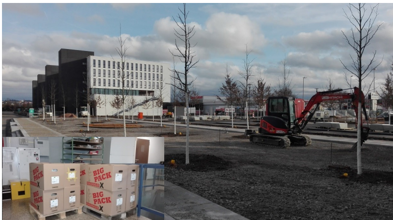
Blick auf das Neubaugebiet. Bild im Bild: Die ersten Umzugskartons sind gepackt.

Unter der Rubrik „Neubau“ finden Sie auf der Internetseite der Landesfeuerwehrschule viele Bilder vom Baufortschritt: https://www.lfs-bw.de/ihrlandesfeuerwehrschule/neubau/Seiten/gebäude1.aspx