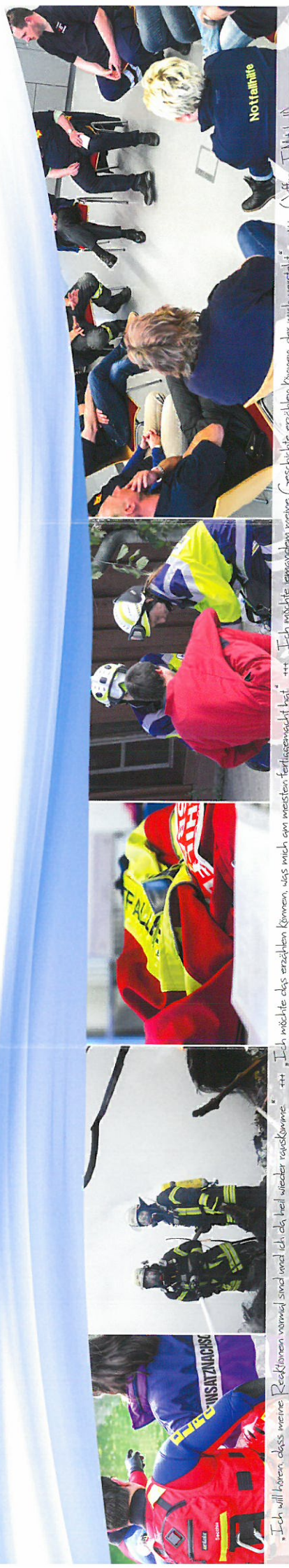
„Ich will hören, dass meine Reaktionen normal sind und ich das heil wieder rauskomme.“ +++ „Ich möchte das ersetzten können, was mich am meisten fertig gemacht hat.“ +++ „Ich möchte demnächst meine Geschäfte eröffnen können, aber nicht...“