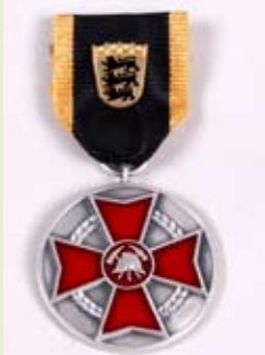
LFV Ehrenmedaille, silber