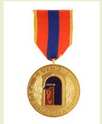
Medaille für internationale Zusammenarbeit, gold