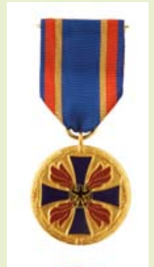
Deutsche Feuerwehr-Ehrenmedaille, Herren