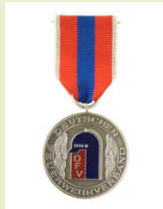
Medaille für internationale Zusammenarbeit, silber