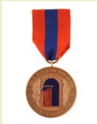
Medaille für internationale Zusammenarbeit, bronze