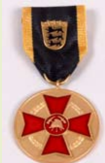
LFV Ehrenmedaille, gold