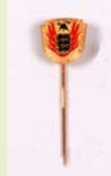
LFV Ehrennadel, gold