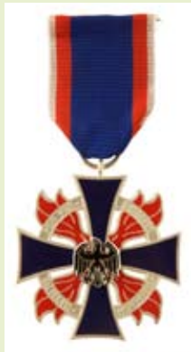
Deutsches Feuerwehr-Ehrenkreuz, silber