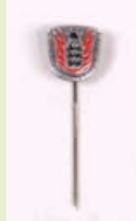
LFV Ehrennadel, silber