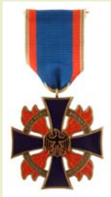
Deutsches Feuerwehr-Ehrenkreuz, bronze