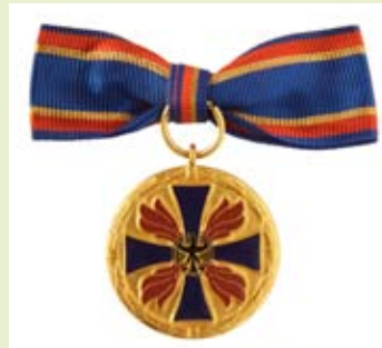
Deutsche Feuerwehr-Ehrenmedaille, Damen