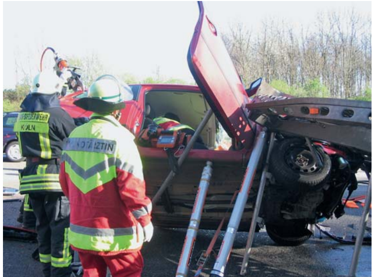
Abb. 12 Sicheres Arbeiten und die Aufnahme von Kräften für die Befreiung des Patienten setzen eine ausreichende Fahrzeugabstützung voraus. Hier: Einsatz des Rettungsdienstpersonals im Fahrzeuginneren und des hydraulischen Rettungsgeräts an der Fahrzeugkarosserie.

Neben einer Redundanz für die gewählte Rettungstechnik muss man ein alternatives technisches Vorgehen planen und bereitstellen.