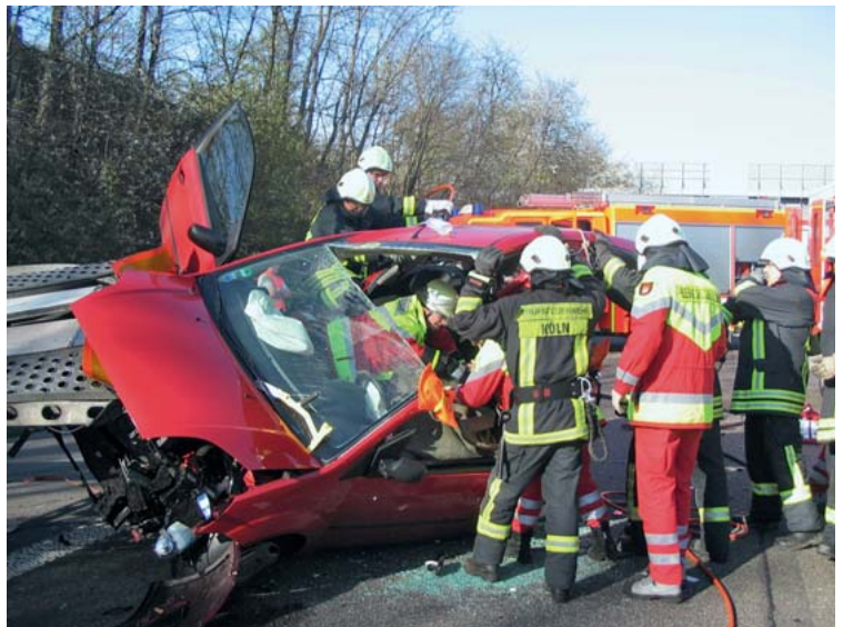
Abb. 13 Nach Durchtrennung der Säulen: Die Dachabnahme ermöglicht die Befreiung des Patienten. Eine notfallmedizinische Versorgung war über die gesamte Dauer der technischen Rettung möglich.