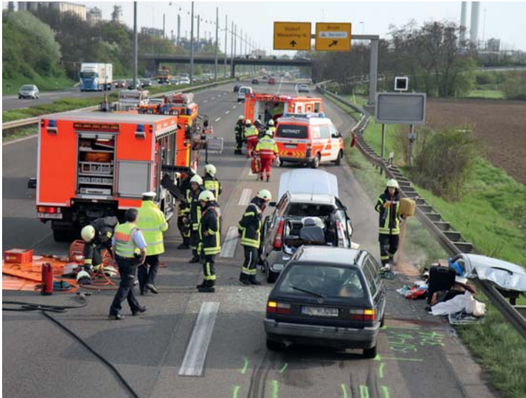
Abb. 4 Die Fahrzeuge des Rettungsdienstes ziehen nach Möglichkeiten an der Einsatzstelle vorbei. Somit ist ein reibungsloser Patiententransport sichergestellt.