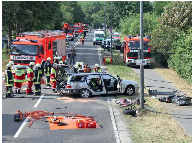
Abb. 3 Wichtig und durch alle Einsatzkräfte eigenständig umzusetzen: Den vorhandenen Raum nicht unnötig durch eigene Fahrzeuge einengen. Eine räumliche Entwicklung der Einsatzstelle zulassen. An- und Abfahrtswege freihalten.

Fahrzeuge der Feuerwehr. Die Fahrzeuge der Feuerwehr zeichnen sich durch ihre Größe, ihr Gewicht und ihren begrenzten Aktionsradius aus. Sie transportieren Material zur Sicherung und Stabilisierung des verunfallten Fahrzeugs, die Löschmittel Wasser, Pulver und Schaum, einen oder mehrere hydraulische Rettungssätze, bestehend aus Spreizer, Schere und Zylinder. Daneben können Geräte wie eine Seilwinde an den