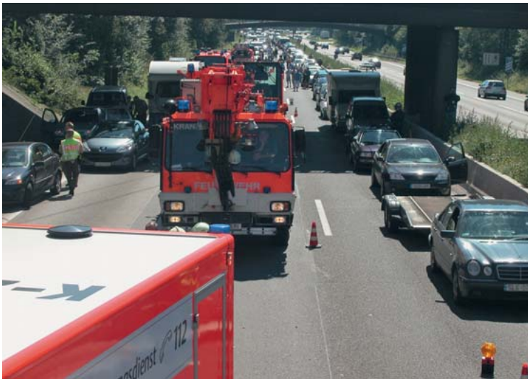
Abb. 5 Ein Blick zurück in die Anfahrtrichtung zeigt die Herausforderung einer zielorientierten Raumordnung.

Großfahrzeugen angebaut sein, denen eine Schlüssel-funktion bei der technischen Rettung zukommen kann. Dementsprechend ist eine schadensortnahe Platzierung dieser Fahrzeuge zielführend.