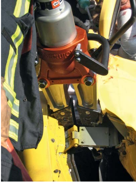
Abb. 14 Höchstbeanspruchung auch für das technische Gerät. Daher alternative technische Systeme und Redundanzen planen und bereitstellen.