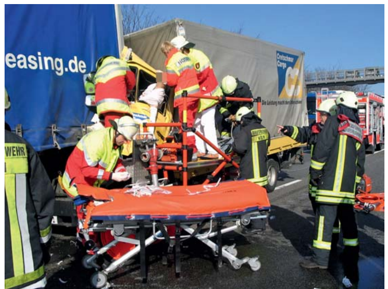
Abb. 1 Der eingeklemmte Patient – interdisziplinäre Herausforderung und Zusammenarbeit auf engstem Raum.

Da kritische Ereignisse verhältnismäßig selten sind und die Funktionsbesetzung der Einsatzkräfte unterschiedlich ausfällt, ist die Zusammenarbeit zwischen Feuerwehr, Rettungsdienst und Notärzten oft nicht routiniert und deshalb auch nicht reibungslos. Die agierenden Personen arbeiten oft das erste Mal unter