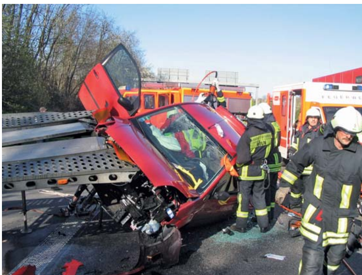
Abb. 9 Eine der Unfalldynamik geschuldeten, unklaren Fahrzeugstabilität muss man erkunden und die Auswirkung von außen wirkender Kräfte abschätzen. Hier: Durch eine Auffahrrampe „aufgespielte“ Fahrzeugkarosserie.

Fahrzeugwerkstoffe und -stabilität. Der Aufwand der technischen Rettung ist abhängig von den verbauten Werkstoffen und der Unfalldynamik. Der unkalkulierbare Wirkungsgrad der eingesetzten Werkzeuge macht folgende Maßnahmen erforderlich: