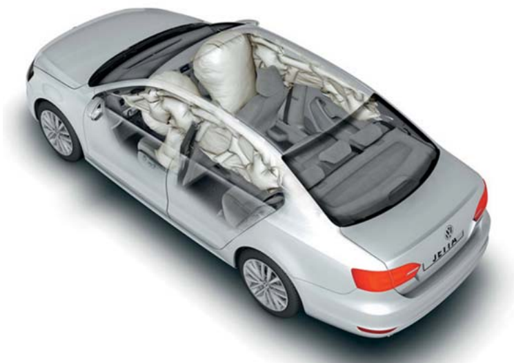
Abb. 10 Moderne Fahrzeuge verfügen über eine umfangreiche Airbagausstattung. Je nach Unfalldynamik werden einzelne oder mehrere Airbags ausgelöst (mit freundlicher Genehmigung der Volkswagen AG).