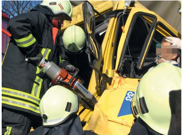
Abb. 2 Eine eindeutige Kommunikation und eine enge, wiederkehrende Abstimmung zwischen den Fachbereichen ist für die Sicherheit von Patient und Einsatzkräften unabdingbar.

Die auf den Fahrzeugen des Rettungsdienstes vorgehaltene Ausstattung ist handlich und lässt einen vom Fahrzeug abgesetzten Betrieb zu. Nachrückende Großfahrzeuge der Feuerwehr können somit ungestört eine Aufstellung im Bereich des Schadensortes einnehmen.