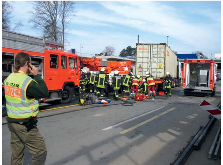
Abb. 15 PKW unter LKW: Höchstleistung aller Disziplinen auf engstem Raum.

Neben der Festlegung des Rettungsmodus ist es empfehlenswert, zwischen den Disziplinen eindeutige Zeitangaben zu verwenden.