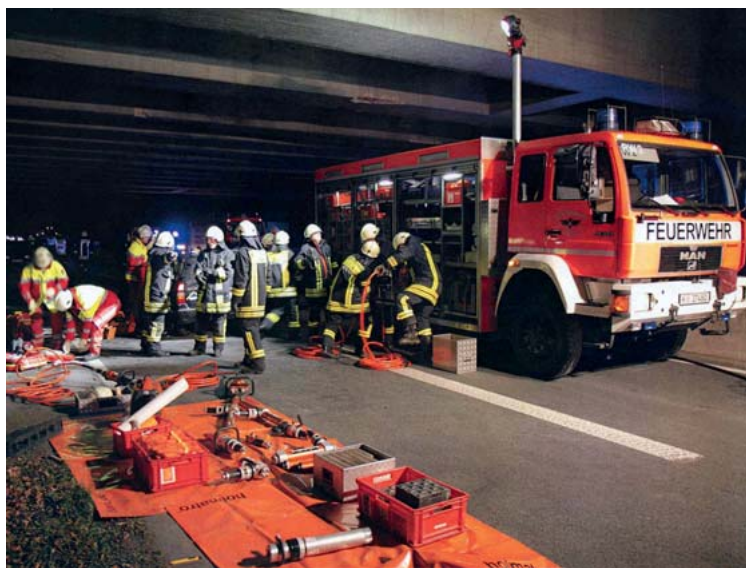
Abb. 11 Klar erkennbar: Eine gute Strukturierung der Einsatzstelle visualisiert Arbeits- und Aufgabenbereiche und senkt hierdurch Kommunikationsbedarf und Einsatzstress.

Grundsätzlich legt der Einsatzleiter einen inneren 5-m-Radius und einen äußeren 10-m-Radius um das verunfallte Fahrzeug als Arbeitsbereiche mit definier-