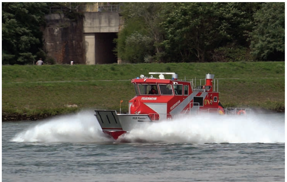
Das Hilfeleistungslöschboot „Pamina 1“ in voller Fahrt

wendig und für Hilfeleistungs- und Brandeinsätze gleichermaßen gebaut. Neben der recht umfangreichen ständigen Beladung kann eine einsatzbezogene Zusatzbeladung mitgeführt werden. Durch seine besondere Aus-