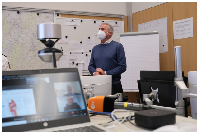
Innenminister Thomas Strobl bei der Vorstellung des Piloten des Nationalen Lagebildes

Was zunächst auf herkömmliche Art und Weise begonnen wird, soll später als digitales Lagebild erstellt werden. Hierzu sollen perspektivisch IT-gestützt und mit Hilfe von KI alle verfügbaren Datenquellen zusammengeführt und analysiert werden, um möglichst frühzeitig auf drohende Gefahrenlagen und Krisensituationen reagieren zu können.