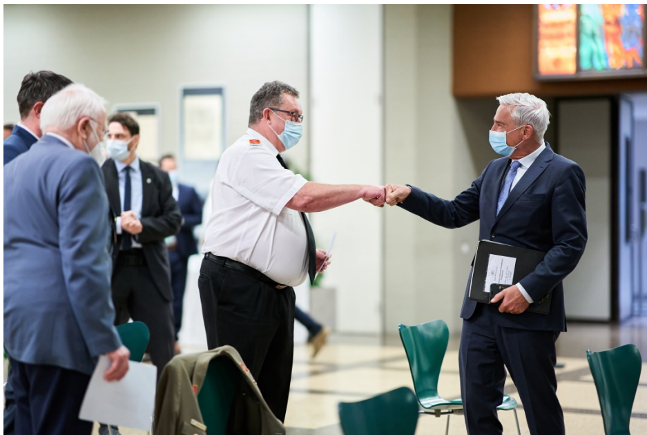
Innenminister Thomas Strobl begrüßt die Gäste.

„Das Ehrenamt im Bevölkerungsschutz ist ja ein ganz besonderes. Menschen, die Verschüttete orten und befreien, die Verletzte versorgen, die andere Menschen aus Autowracks schneiden, die Brände löschen, die sich bewusst für andere in Gefahr, ja sogar in Lebensgefahr, bringen: solche Frauen und Männer sind unsere ‚Helden des Alltags‘ und ihr Engagement ist alles andere als selbstverständlich. Unsere ehrenamtlichen Helferinnen und Helfer schultern besonders beeindruckende 90 Prozent aller Einsätze – und ich betone es ausdrücklich: ehrenamtlich. Sie beweisen täglich in den unterschiedlichsten Einsätzen ihr Können“, so Minister Strobl.