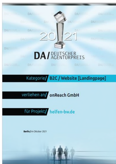
Die Urkunde des Deutschen Agenturpreises 2021 für die Agentur onReach GmbH

(ID) Für die Gestaltung der Website www.helfen-bw.de wurde die Agentur onReach GmbH mit dem Deutschen Agenturpreis 2021 ausgezeichnet. Die Website ist ein zentraler Baustein der Kampagne zur Nachwuchsgewinnung im Bevölkerungsschutz Baden-Württemberg.