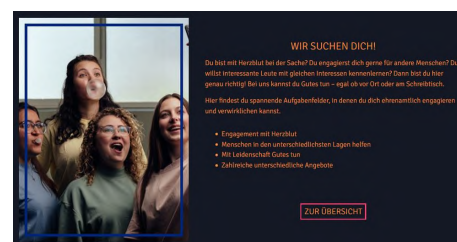
Screenshots der Website www.helfen-bw.de

Der Deutsche Agenturpreis wird jährlich an Werbe-, Marketing- und Inter-