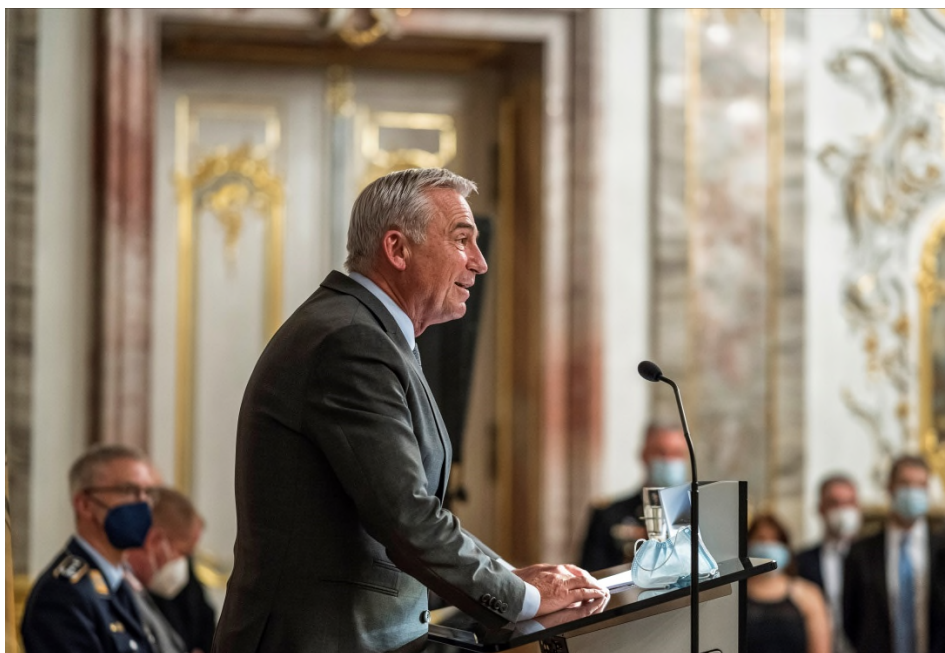
Innenminister Thomas Strobl bei seiner Ansprache

(ID) Innenminister Thomas Strobl hat am 11. November 2021 rund 200 Vertreterinnen und Vertreter der Bundeswehr und der befreundeten Streitkräfte aus Europa und den USA sowie aus Polizei, Politik, Wirtschaft und Verwaltung zum Jahresempfang der Landesregierung für die im Land stationierten Streitkräfte im Bruchsaler Schloss empfangen. Das Landespolizei-Orchester Baden-Württemberg musizierte bei einer von Fackeln erleuchteten Serenade im Schlosshof.