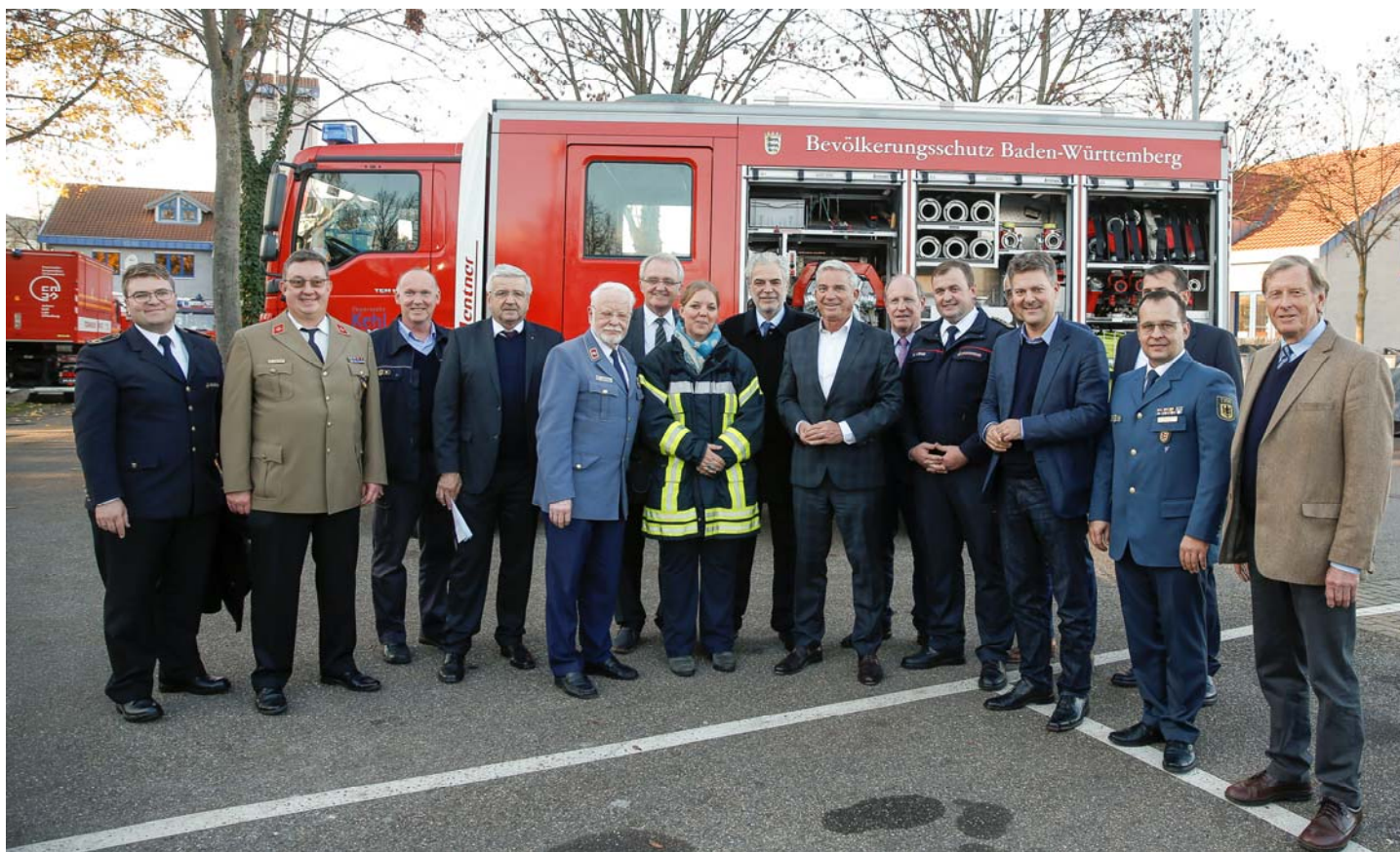
Gruppenbild mit den Vertretern der Organisationen in der „Bevölkerungsschutzfamilie“.

beteiligten Einheiten des Deutschen Roten Kreuzes, der Malteser und der Johanniter, des ASB, der DLRG und der Bergwacht Schwarzwald, des Bundesverbandes Rettungshunde sowie dem THW und dem Team der Notfallseelsorge für die tolle Unterstützung und Präsentation der Fähigkeiten des Bevölkerungsschutzes.