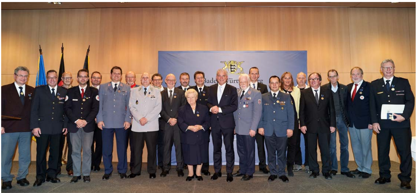
Innenminister Thomas Strobl (Bildmitte) und die Preisträgerinnen und Preisträger beim Gruppenbild.

Informationen zum Bevölkerungsschutz-Ehrenzeichen, die Ausführungsbestimmungen sowie die Bekanntmachung über die Stiftung des Ehrenzeichens finden Sie auf der Internetseite des Ministeriums für Inneres, Digitalisierung und Migration unter: https://im.baden-wuerttemberg.de/de/sicherheit/katastrophenschutz/ehrenzeichen-bevoelkerungsschutz/ .