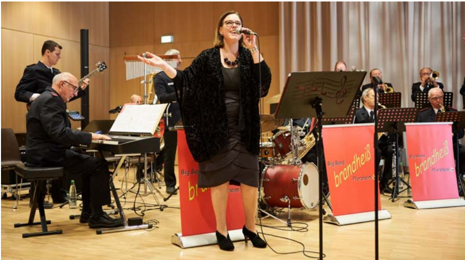
Für die musikalische Umrahmung des Empfang und den guten Ton sorgte „brandheiß“, die Big Band der Feuerwehr Pforzheim.

das Baden-Württemberg so lebenswert mache. Die ehrenamtlich Engagierten seien ganz und gar unverzichtbar für das Land. Doch ohne hauptamtliches Personal gehe es im Bevölkerungsschutz auch nicht. Das gelte für die Hilfsorganisationen, das gelte aber auch für die staatlichen Stellen, wie zum Beispiel die Katastrophenschutzbehörden in den Stadt- und Landkreisen und in den Regierungspräsidien. „Wir sind froh und dankbar, dass wir an diesen Schaltstellen hochmotivierte Kolleginnen und Kollegen haben, die wissen wofür sie morgens aufstehen und zur Arbeit gehen: für nichts Geringeres als die Sicherheit der Menschen in unserem Land“, erklärte Innenminister Thomas Strobl. Mit dem Bevölkerungsschutz-Ehrenzeichen 2018 wurden ausge-