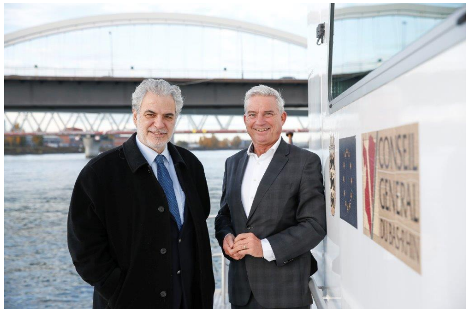
Innenminister Thomas Strobl und EU-Kommissar Christos Stylianides

Vor dem Hintergrund der aktuellen Bestrebungen der EU-Kommission, die Katastrophenabwehrkapazitäten der EU zu stärken und die Kompetenzen der EU im Katastrophenschutz auszudehnen, plädierte Thomas Strobl dafür, dass Katastrophenschutz auch zukünftig Ländersache bleiben müsse: „In Situationen, in denen nationale Ansätze nicht mehr ausreichen und