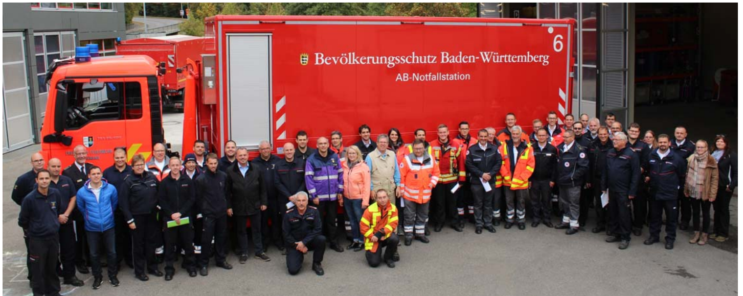
Die Reihe „Notfallstation auf Tour“ fand in Backnang ihr vorläufiges Ende.

Wesentliche Ziele des Seminars sind, die „Multiplikatoren“ in die Lage zu versetzen, in ihren Organisationen Grundwissen zum Einsatzkonzept Notfallstation weiterzugeben und das hohe Sicherheits- und Schutzniveau für die Einsatzkräfte kennenzulernen.